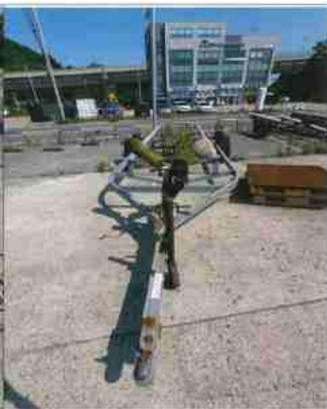
2. 번호판 부재