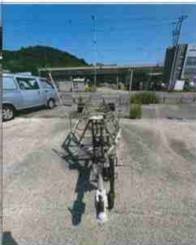
4. 번호판 부재