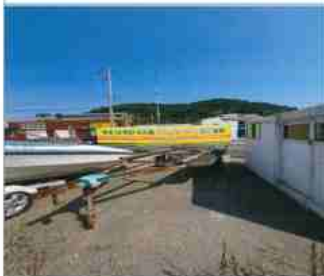
7. 번호판 부재