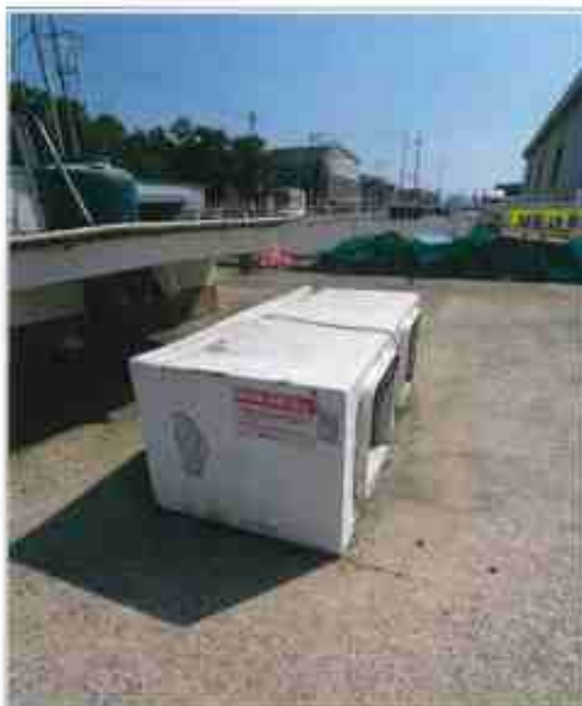
11. 기타 적치물①(3.56m×2m)