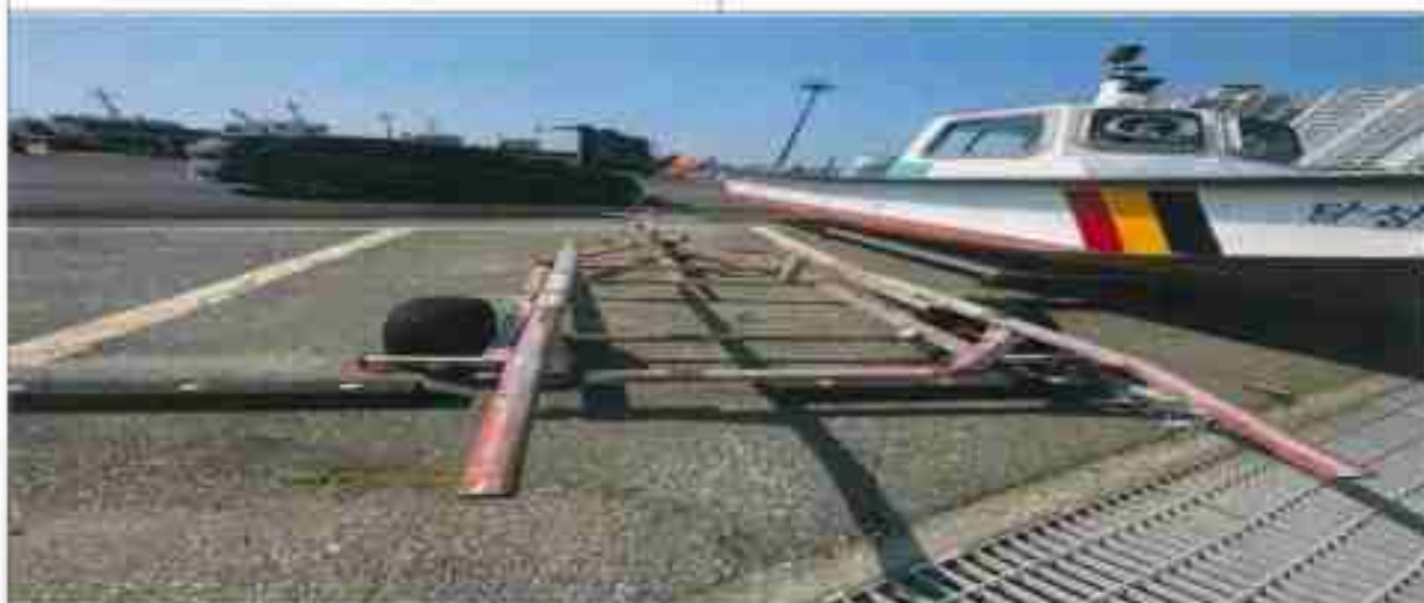
9. 번호판 부재