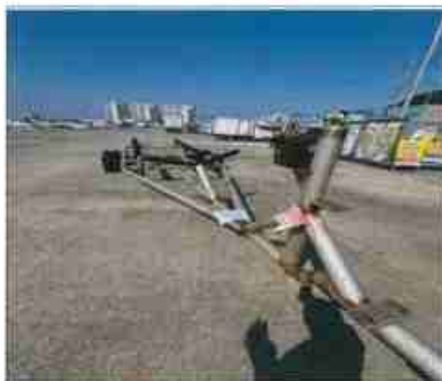
5. 번호판 부재