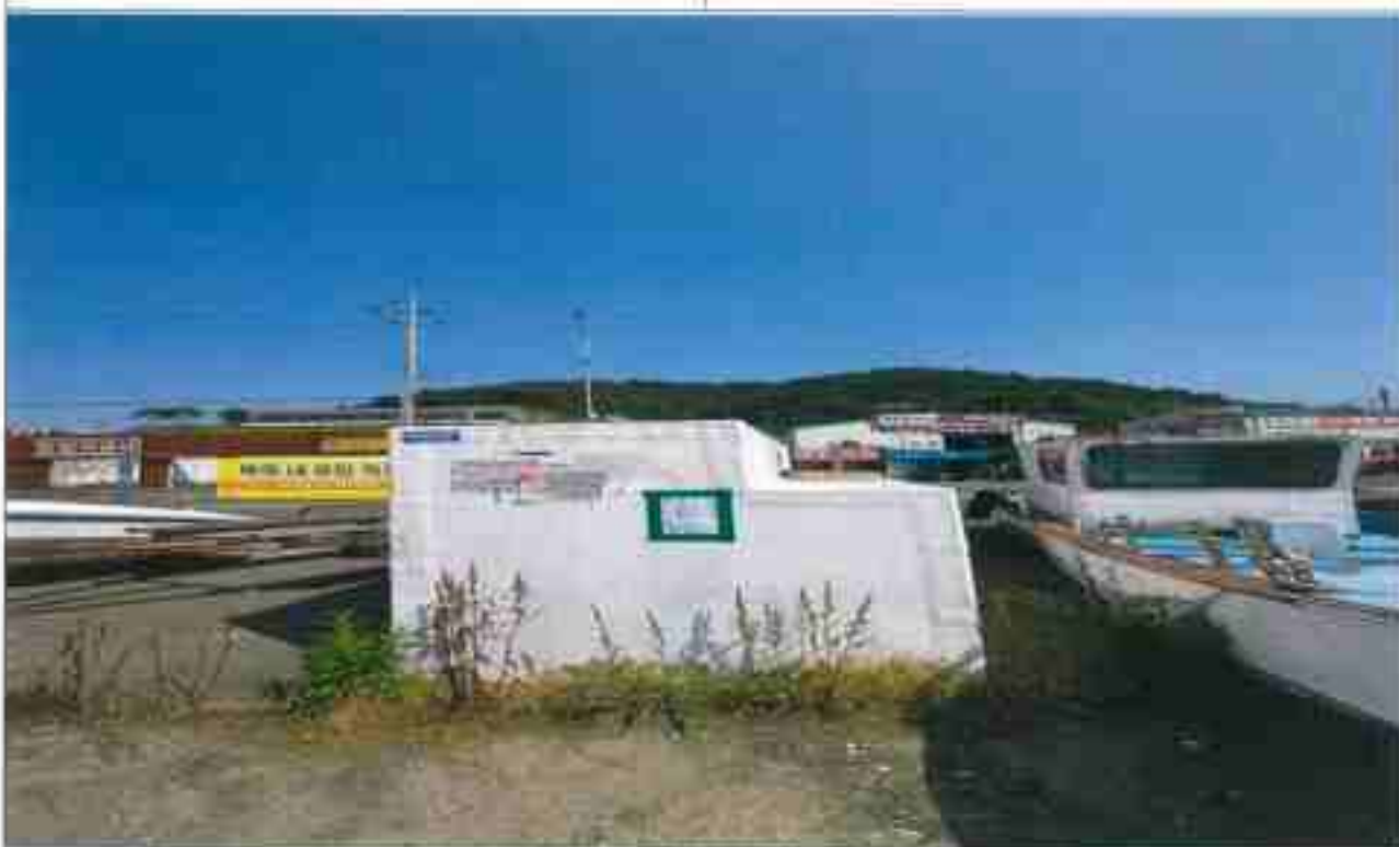
13. 기타 적치물③(3.31m×1.82m)