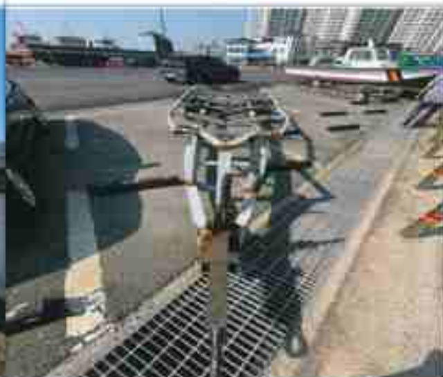
8. 번호판 부재