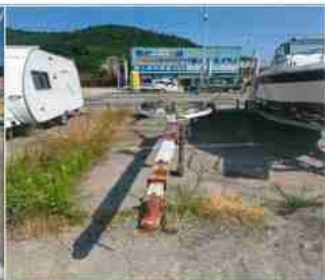
6. 번호판 부재