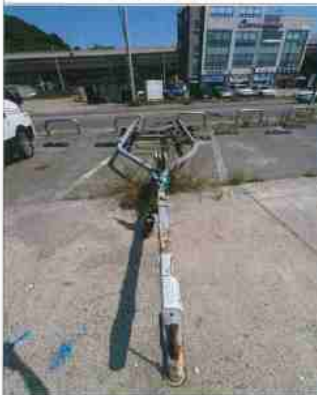
3. 번호판 부재