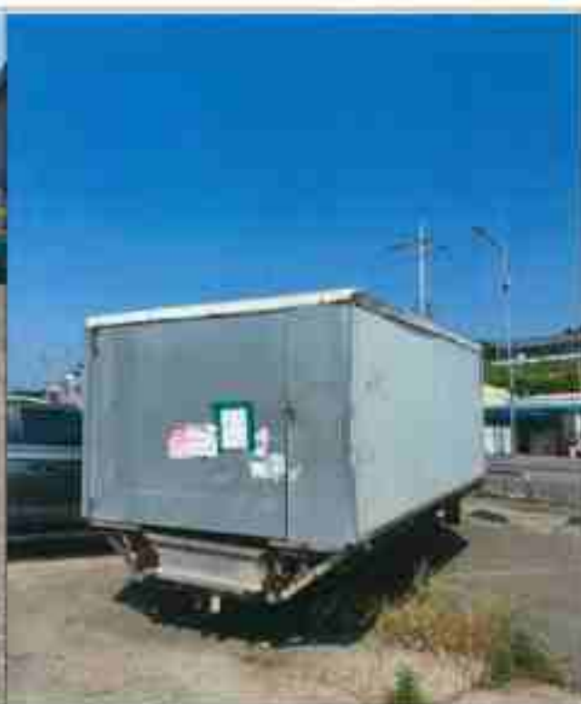
12. 기타 적치물②(3.56m×2m)