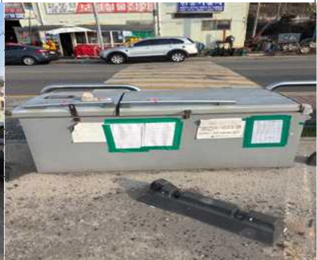
6. 기타 적치물①(1.72m×0.84m)