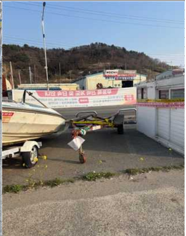
6. 번호판 부재