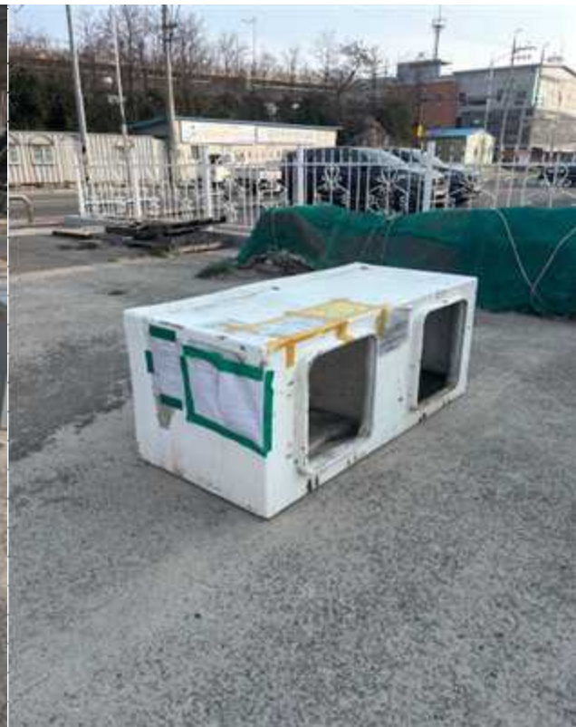
8. 기타 적치물③(3.56m×2m)