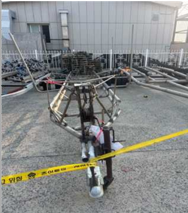
3. 번호판 부재