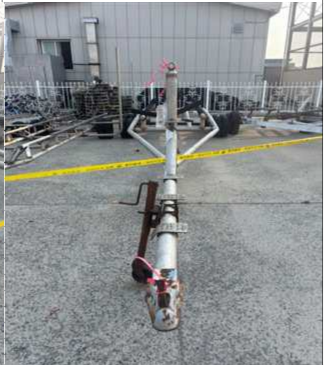
4. 번호판 부재