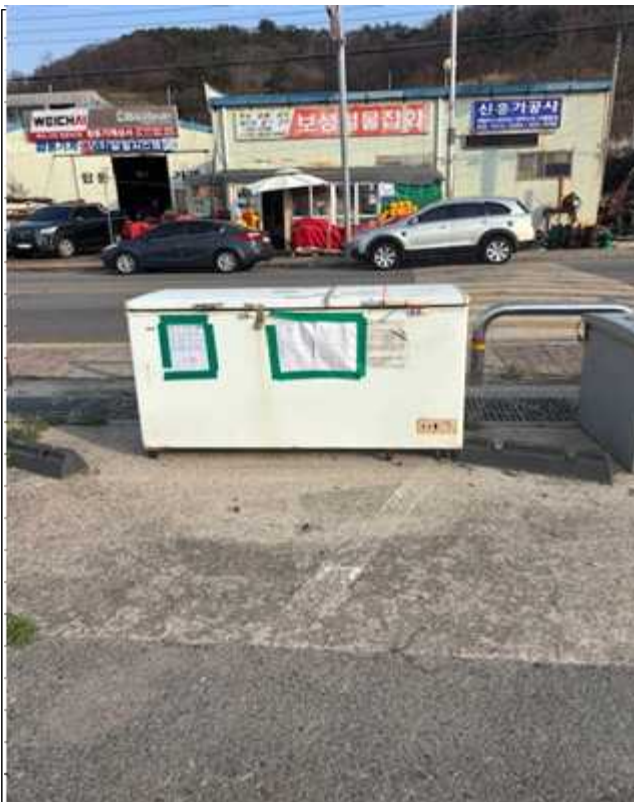
7. 기타 적치물②(1.69m×0.67m)