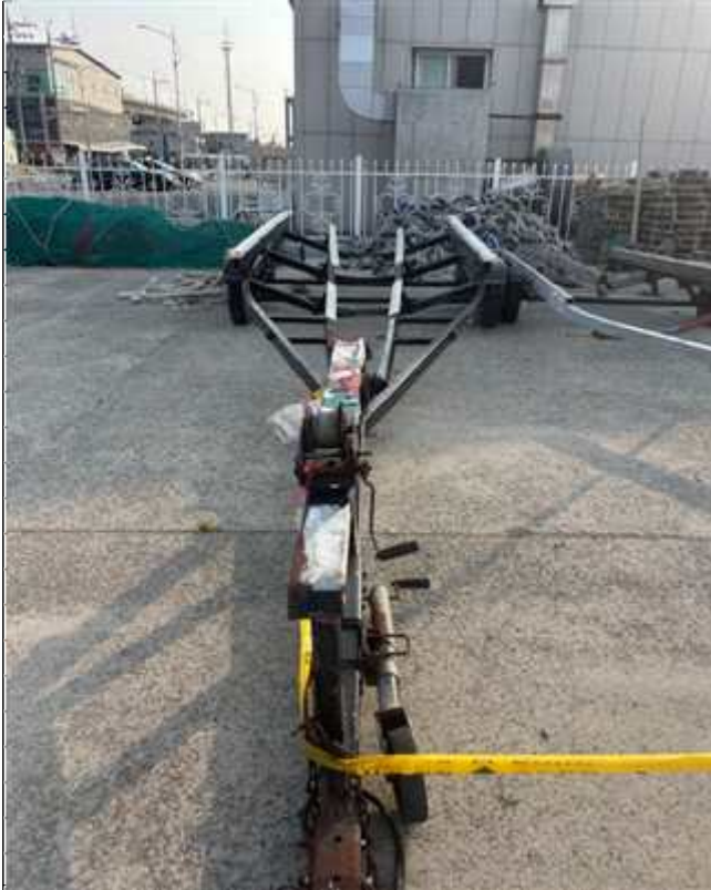
1. 번호판 부재