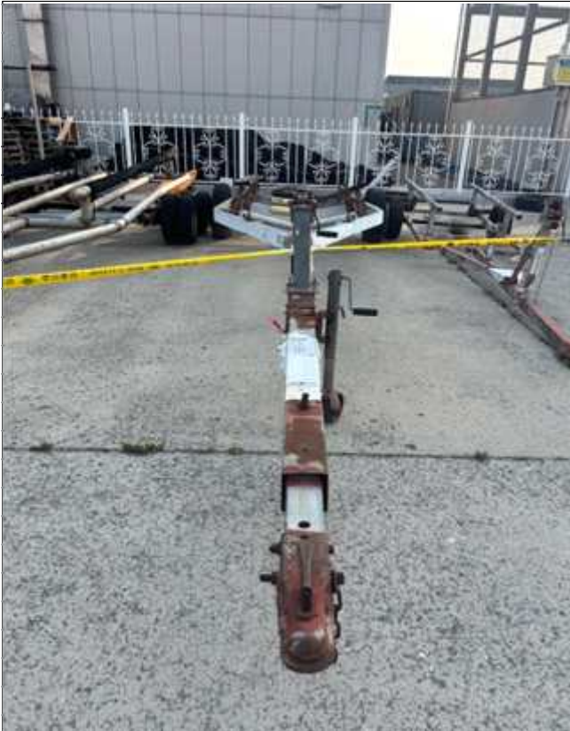
5. 번호판 부재