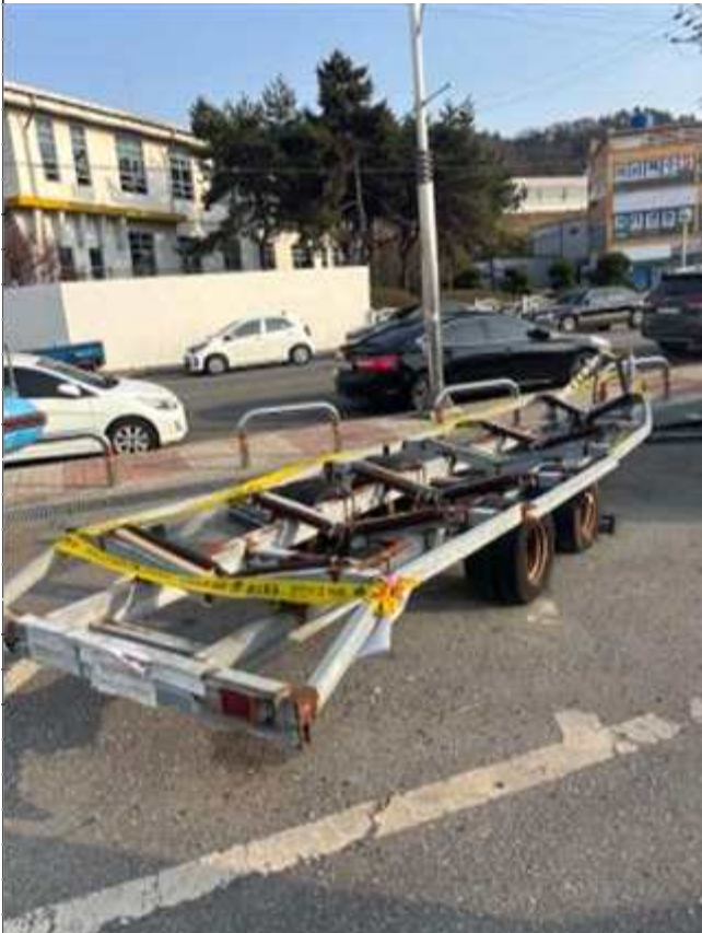
7. 번호판 부재