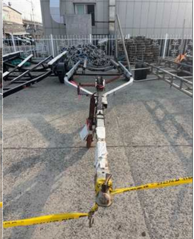
2. 번호판 부재