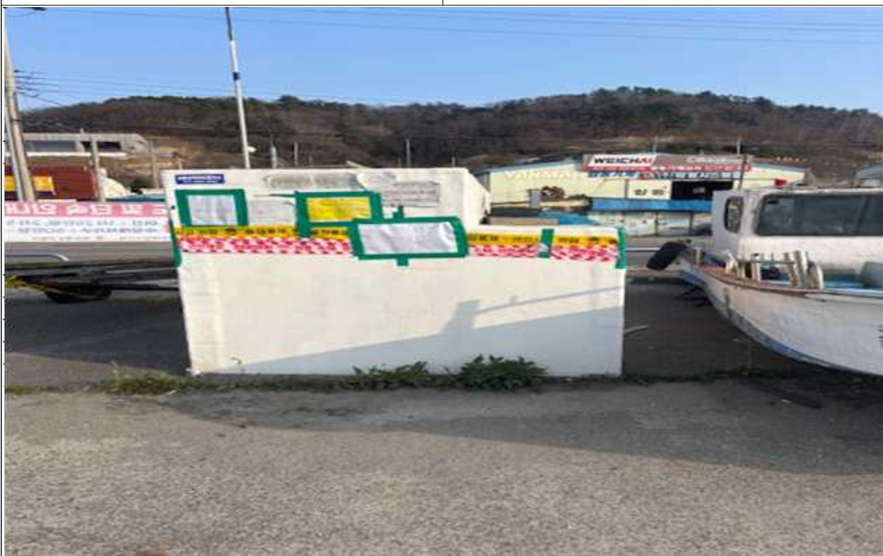
9. 기타 적치물④(3.31m×1.82m)